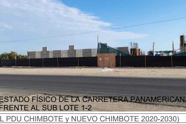
ESTADO FÍSICO DE LA CARRETERA PANAMERICANA FRENTE AL SUB LOTE 1-2